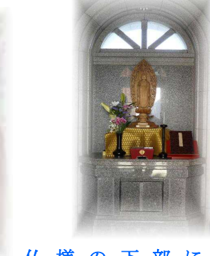
仏様の下部に合葬用カロートがあります

※個別納骨壇にお祀りする期間は、13回忌または、納骨されてからから13年、期間の延長は 応談させていただきます