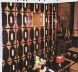
本堂内お骨預かり所